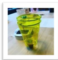
再生可能な電子スピーカー